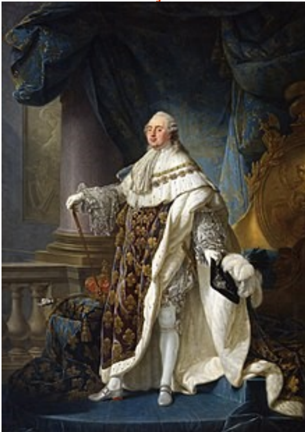
Doc 1 : Louis XVI en costume de sacre 1773 d'Antoine-François Callet