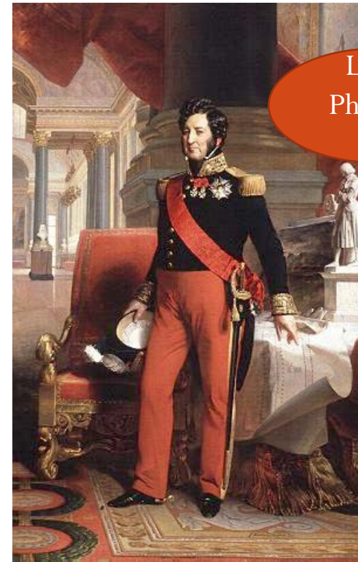
Louis Philippe Ier

Doc 5 : Monarchie de juillet (1830-1848)