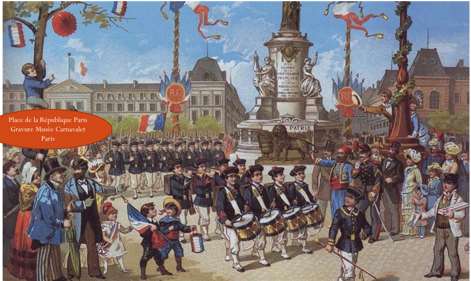
Place de la République Paris Gravure Musée Carnavalet Paris