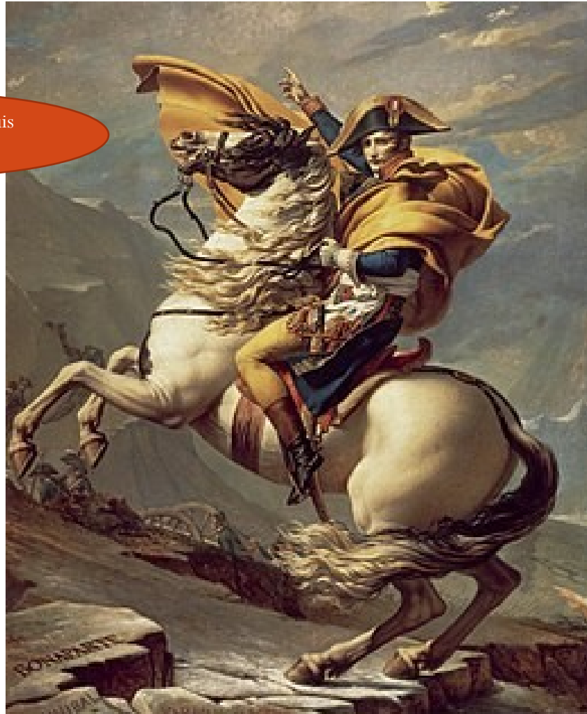
Tableau de Jacques-Louis David