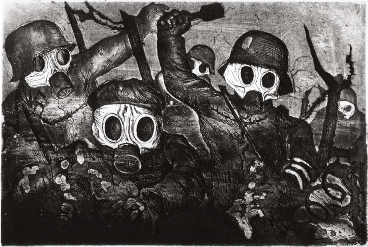
Assaut sous les gaz, gravure, Otto Dix, 1924