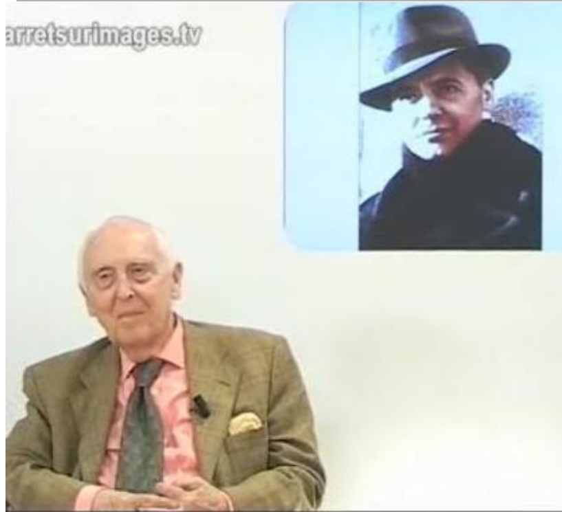
Daniel CORDIER (né en 1920)