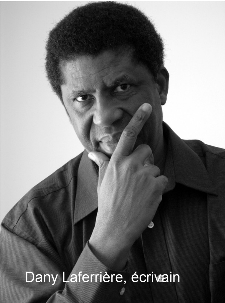
Dany Laferrière, écrivain