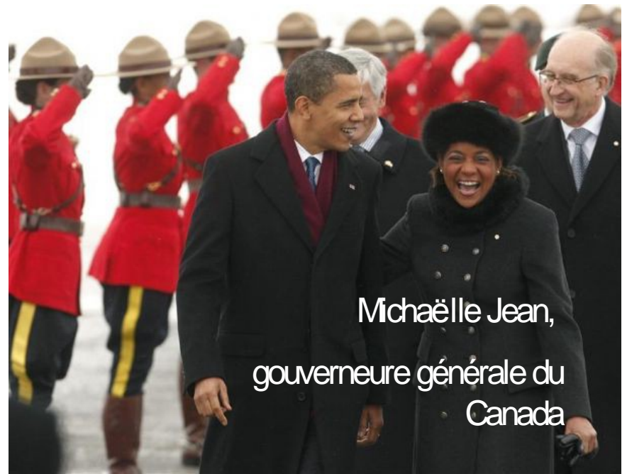
Michaëlle Jean, gouverneure générale du Canada