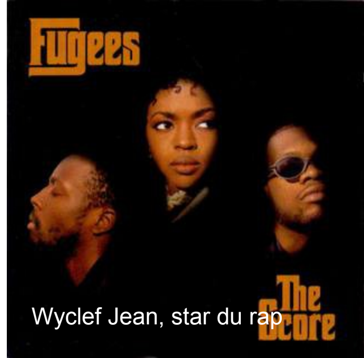
Wyclef Jean, star du rap